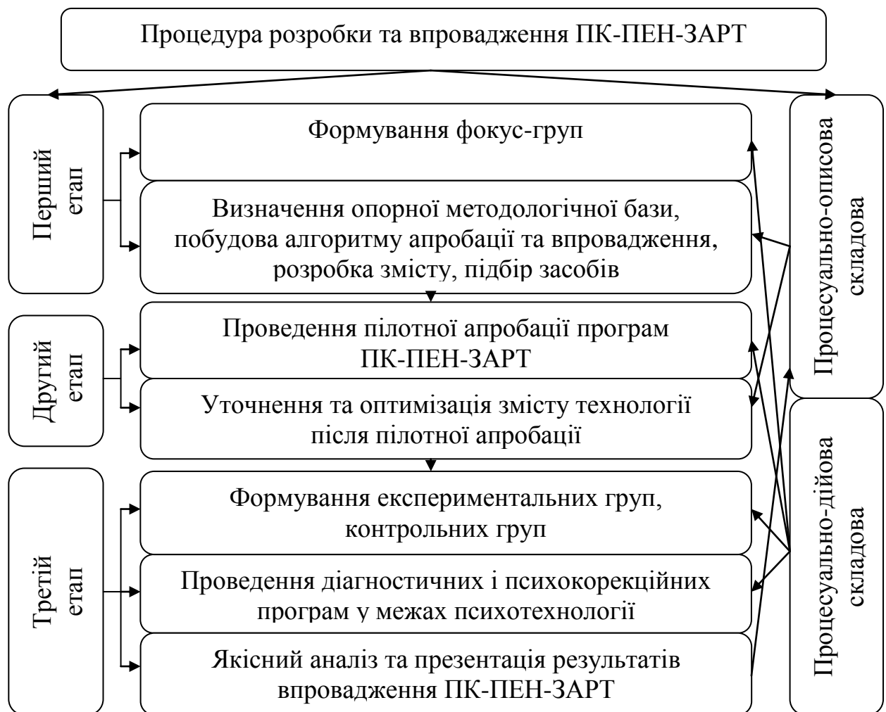
Рис. 1. Схема процедури розробки та впровадження психотехнології психокорекції проявів емоційної нестабільності у майбутніх психологів засобами арт-терапії.

розробки та впровадження психотехнології корекції проявів емоційної нестабільності у майбутніх психологів. Робота фокус-груп була організована за принципом «чат-спілкування» в онлайн режимі. Експертами виступали теоретики та практики вітчизняної і міжнародної спільноти психологічної галузі. До експертної діяльності долучилося 43 особи. Нижче презентовано рис. 1, що був створений на основі спільної діяльності трьох фокус-груп, який схематично висвітлює процедуру розробки та апробації ПК-ПЕН-ЗАРТ.