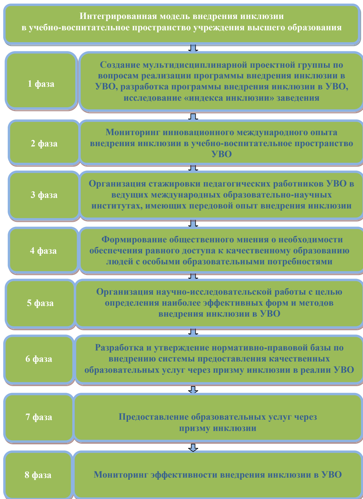
Рис 2. Интегрированная модель внедрения инклюзии в учебно-воспитательное пространство учреждения высшего образования